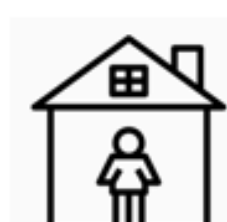
居家 檢疫 者